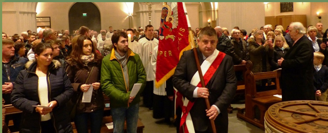
DZIĘKCZYNIENIE W HAMBURSKIEJ KATEDRZE W 100. ROCZNICĘ NIEPODLEGŁOŚCI POLSKI